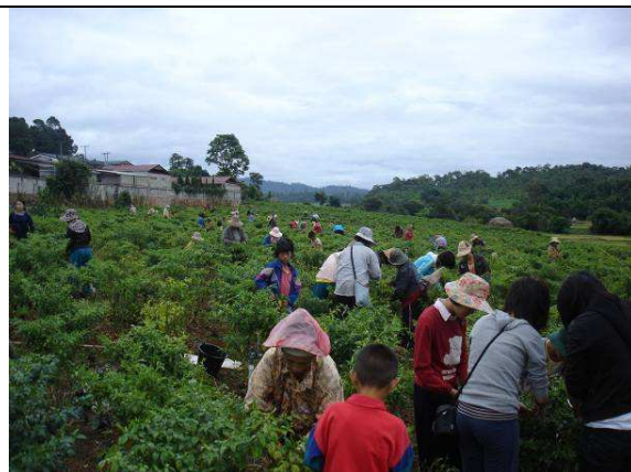
07/12 採辣椒 體驗鄉村生活