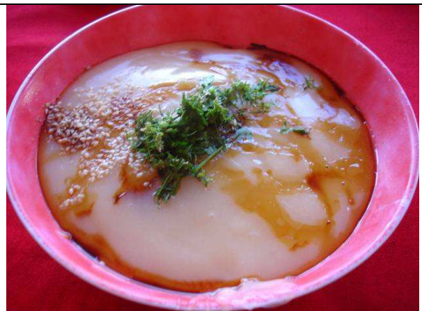
07/21 當地特色小吃 稀豆粉