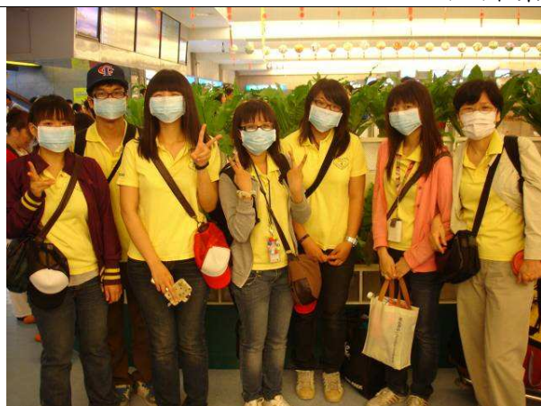
07/02 桃園國際機場 防疫工作不可少