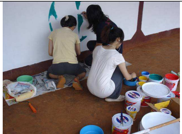
07/20 育英中學圖書室外牆粉刷