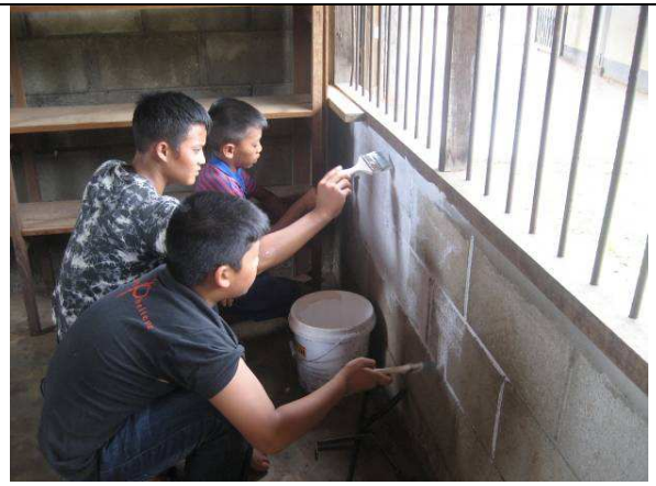
07/10 暹華小學圖書室粉刷