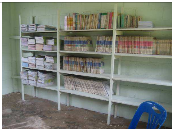
07/20 暹華小學圖書室粉刷與圖書整理完畢 附件六