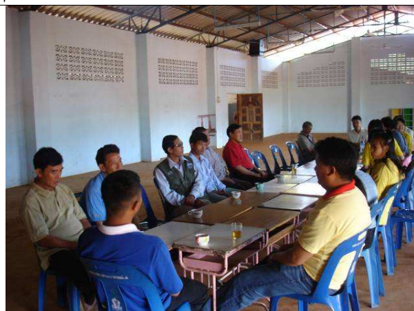
07/03 與泰北董事會及教師相見歡