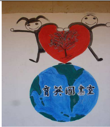
07/24 WISLA LOGO 完成