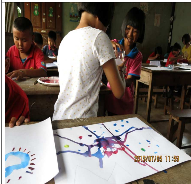
將繪畫帶入學生課程，快樂學習