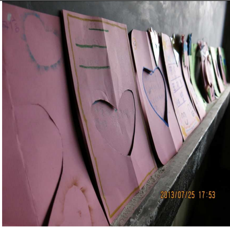
利用成果展向爸媽勇敢表達愛