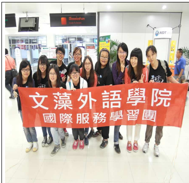
抵達清邁機場，WISLA全體合照