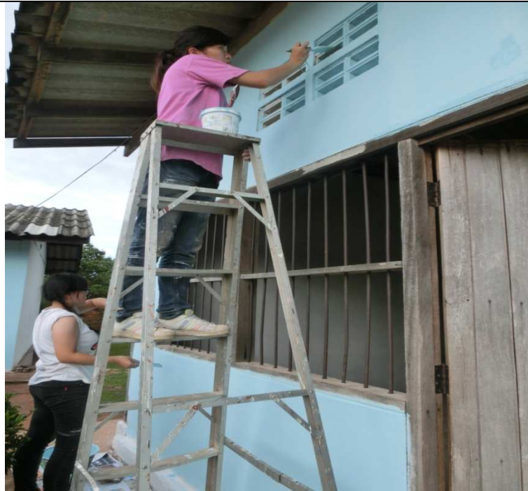
為學校重新上漆的團員