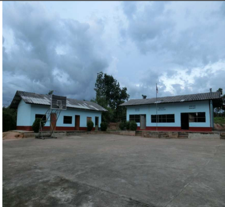
油漆後的學校，全部煥然一新