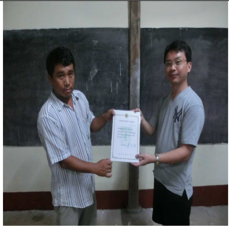
文藻與泰北華校互贈感謝狀