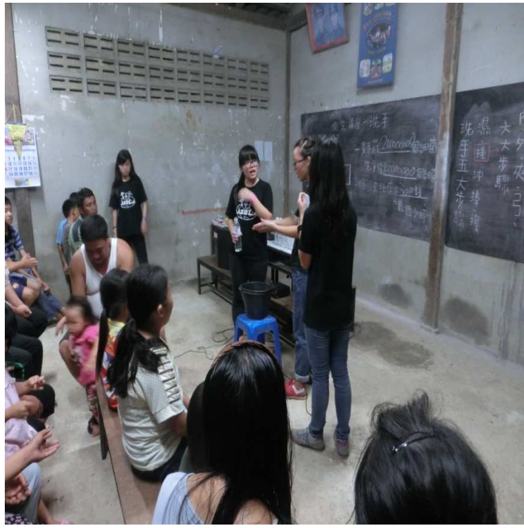
村民洗手衛生講座