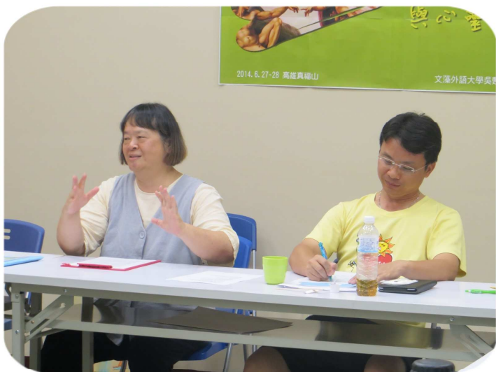
←王漪老師分享心靈有約課程施行經驗