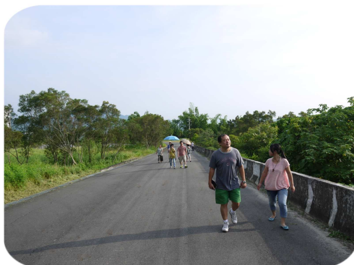
在高雄真福山社福園區中體驗大自然→