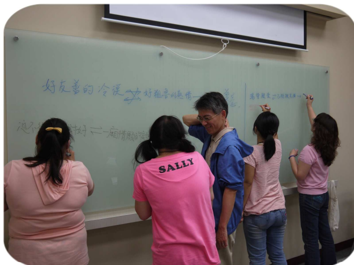
←對於青年靈性教育進行腦力激盪