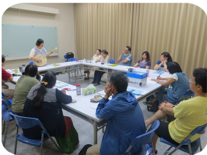
←王漪老師邀請參與者一同體會 靈性教育中音樂的應用