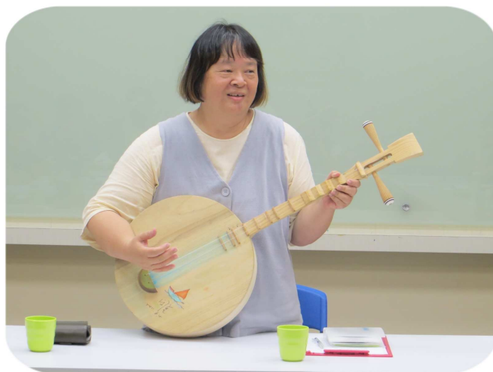
王漪老師示範音樂應用於靈性教育→